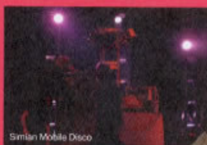
Simian Mobile Disco